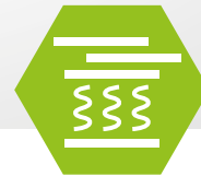
Servo Vibration System